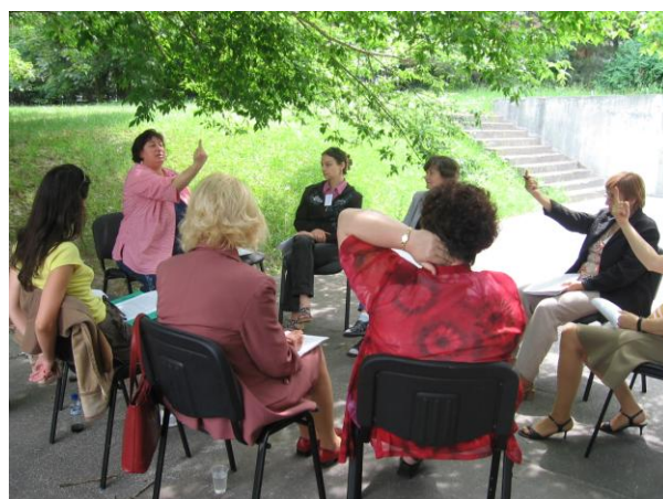
Školenie dobrovoľníkov ELLA v máji 2007