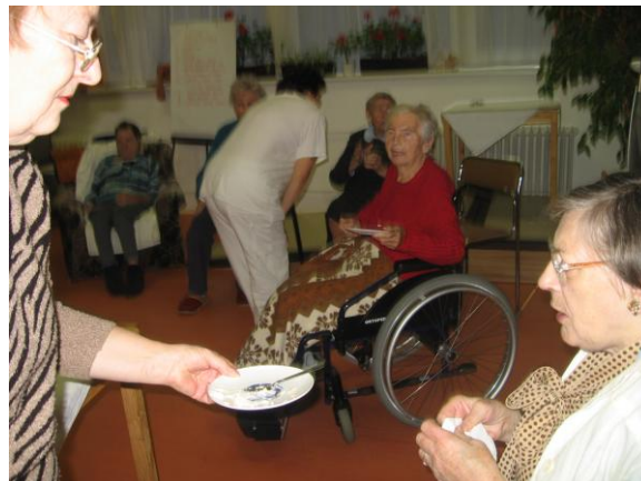
Katarínska zábava dobrovoľníkov a klientov