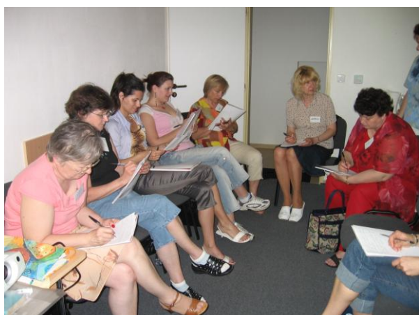
Školenie dobrovoľníkov ELLA v máji 2007

V roku 2007 sme nadviazali spoluprácu s Domovom dôchodcov Hestia a uskutočnili sme nábor prostredníctvom internetu a inzerátov v regionálnych reklamných novinách. V priebehu apríla – mája 2007 sa nám prihlásilo 10 uchádzačov, pričom sme prostredníctvom dotazníka a osobného pohovoru vybrali 8 dobrovoľníčok , ktoré sme počas dvoch víkendov na prelome mája a júna vyškolili v uvedených témach podľa spoločného medzinárodného curricula. Nadviazali sme spoluprácu so šiestimi lektorkami , ktoré sa venujú práci so seniormi, chorými a umierajúcimi a dobrovoľníkom sme zabezpečili pravidelnú skupinovú supervíziu pod dohľadom psychologičky . Na týchto spoločných stretnutiach sa dobrovoľníci raz do mesiaca stretnú, kde majú možnosť podeliť sa o svoje skúsenosti z okamihov sprevádzania. Môžu si navzájom poradiť, ako zvládnuť náročné situácie a povzbudiť sa v ďalších návštevách.