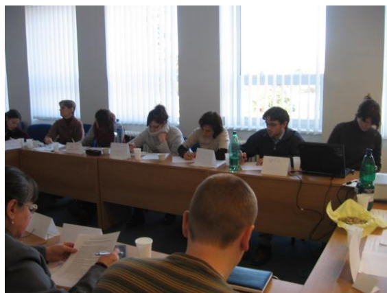
Stretnutie dobrovoľníckych organizácií, Iuventa, marec 2007