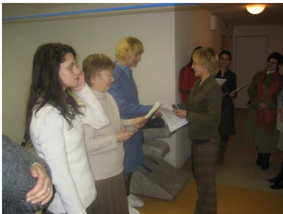
Odovzdávanie certifikátov ELLA Medzinárodný deň dobrovoľníkov

však už nezrozumiteľne, a to najmä vtedy, ak je hladná alebo smädná. Podá mi ruku alebo obidve, tak sedíme oproti sebe, držím jej ruky a hladkám ich. Po chvíľke ticha jej poviem informáciu napr. o počasí, prezrieme si kalendár s menami, rozvešané vianočné ozdoby alebo inú výzdobu a pod. V lete sme sedávali na terase, raz sme boli aj v záhrade, ktorá je okolo budovy.“