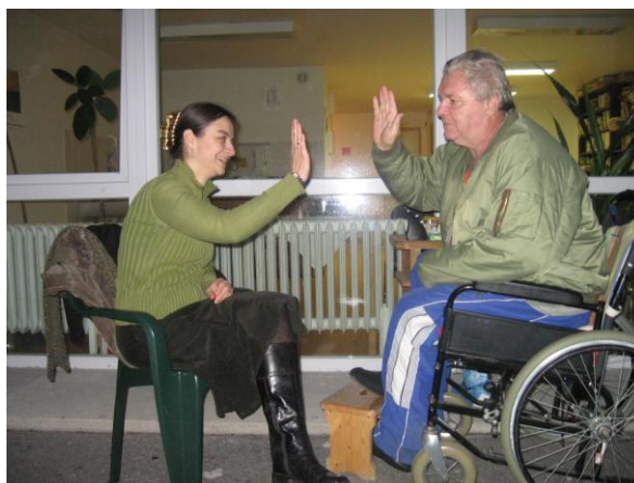
Dobrovoľníčka s klientom